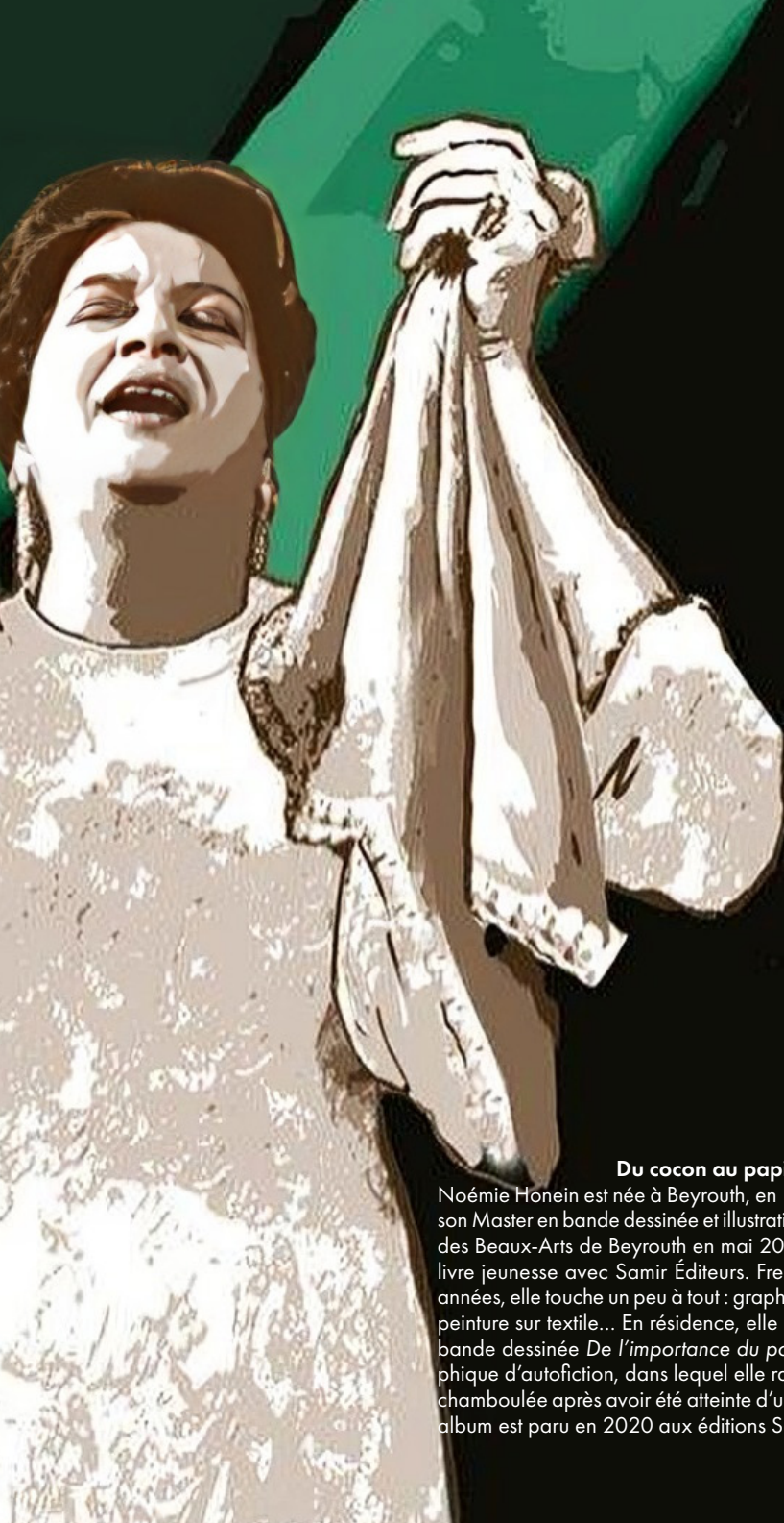
TABLE RONDE 2