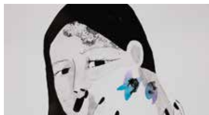
Sofia El Khyari, L'Ombre des papillons , 2022.