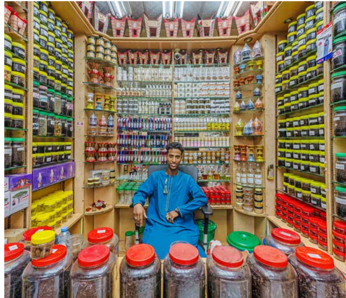
Vladimir Antaki, The Guardians - Mohamad Obeidi, Mascate (Oman), 2023.

Objet de l'intime et de la sphère privée, le parfum emplit aussi l'espace public des villes arabes et agit comme un marqueur social. Offrande aux divinités dans l'Antiquité, il n'a cessé d'être depuis un médiateur entre le visible et l'invisible. Ce cycle de tables rondes associe des spécialistes de l'Antiquité, de la période médiévale et de la période contemporaine pour nous plonger dans l'univers à la fois familier et mystérieux du parfum.