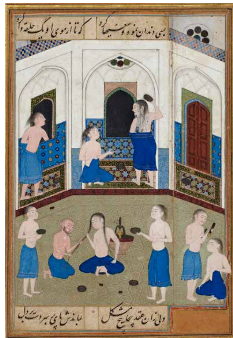
'Asâr al-Tabrîzî, « Mihr dans un hammam à Khwarazm », Mihr wa Mushtari (Mihr et Mushtari) , Shirâz (Iran), copie datée entre 1540 et 1550. Encre, gouache et feuilles d'or sur papier.

l'Arabie, terre de l'encens, de l'ambre gris et de la myrrhe, joue un rôle majeur dans le commerce des parfums. Rose, safran, jasmin poussent du bassin méditerranéen au Proche-Orient. D'autres matières premières sont récoltées au prix de périls innombrables dans