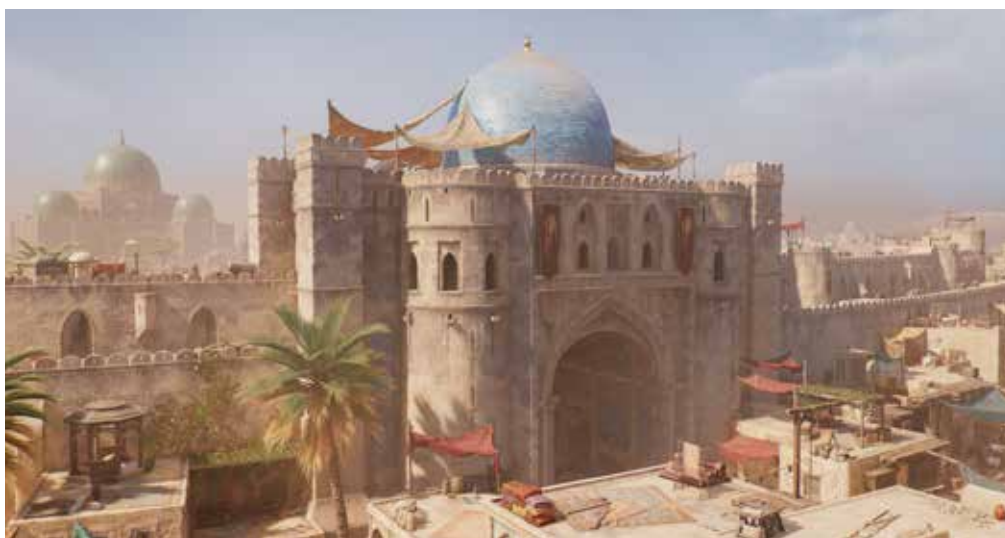
Vue de la Porte de Basra dans Assassin's Creed Mirage.

Trois objets conservés à l'Institut du monde arabe ont pris place dans « History of Baghdad », qui permet aux joueurs d'Assassin's Creed® Mirage d'en savoir plus sur la ville de Bagdad du IX e siècle – ou plus exactement sur Madinat al-Salam, mythique capitale abbasside entièrement détruite au XIII e siècle, sur les ruines de laquelle fut érigée la capitale de l'Irak moderne. À cette occasion, le musée de l'IMA retrace les recherches ayant présidé à la restitution d'une cité dont on ne peut imaginer la forme au IX e siècle qu'en se fondant sur les sources littéraires et archéologiques.