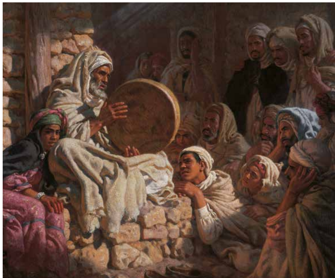
Étienne Dinet (1861-1929), Meddah aveugle chantant l'épopée du prophète ou Le Conteur arabe . Huile sur toile, 130x163 cm, vers 1922. Collection privée.

En 1904, le peintre s'installe à demeure dans l'oasis de Bou-Saâda. Il achète dans la ville indigène une maison pourvue d'une terrasse, de laquelle il peut à loisir contempler le