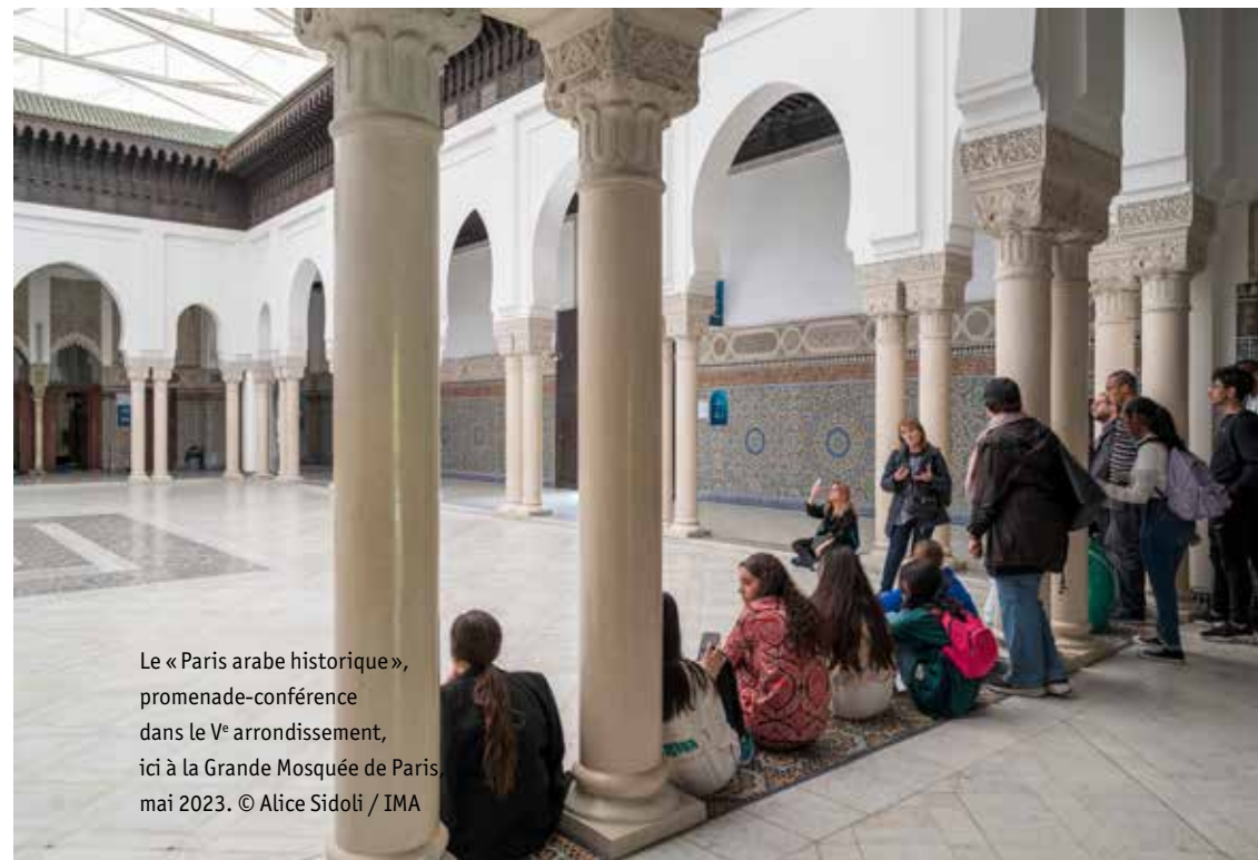
Le « Paris arabe historique », promenade-conférence dans le V e arrondissement, ici à la Grande Mosquée de Paris, mai 2023.

▶ LUNDI 29 JANVIER | SALLE DU HAUT CONSEIL (NIVEAU 9) | ACCÈS LIBRE DANS LA LIMITE DES PLACES DISPONIBLES, RÉSERVATION OBLIGATOIRE PAR MAIL : BMOUTON@IMARABE.ORG