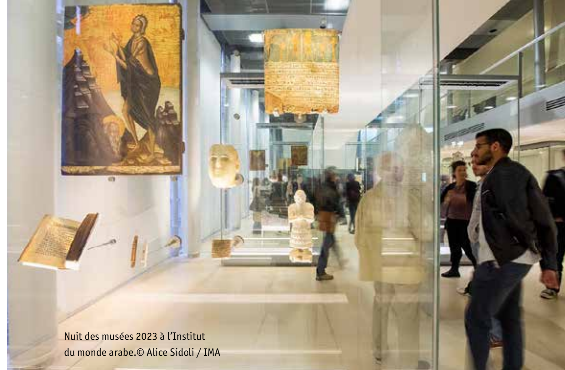
Nuit des musées 2023 à l'Institut du monde arabe.

Dès le VII e siècle, la ville arabe retranscrit l'organisation de la société musulmane avec son palais, qui est aussi l'atelier des arts ; la mosquée qui lui est associée, tandis que l'église et la synagogue réunissent les fidèles des autres confessions dont les objets de culte adoptent l'esthétique locale ; la madrasa, où s'élaborent et se transmettent les savoirs ; le souk, centre névral-