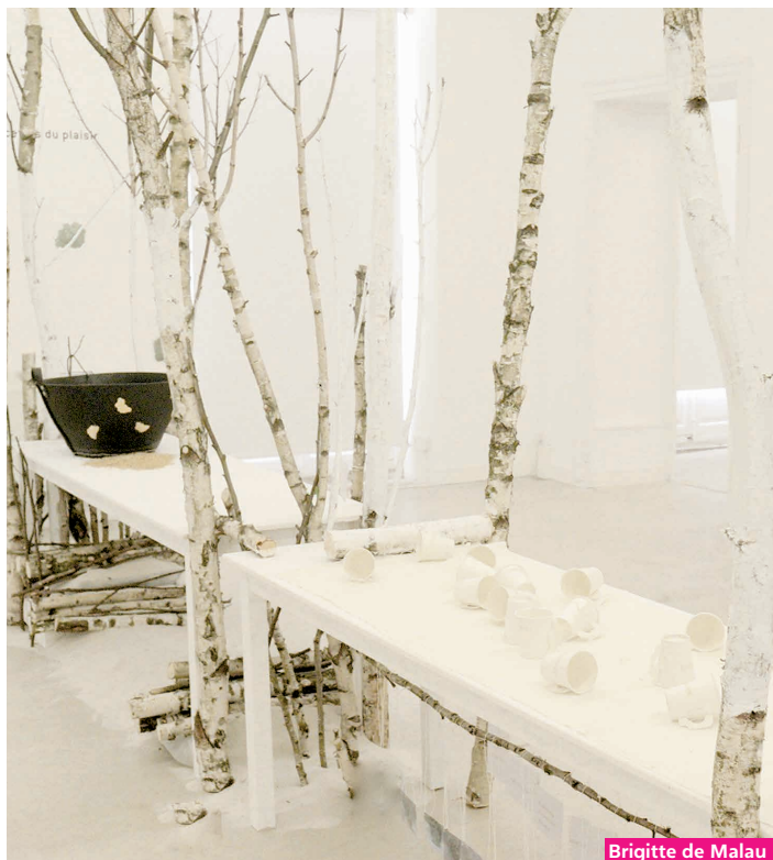
Brigitte de Malau