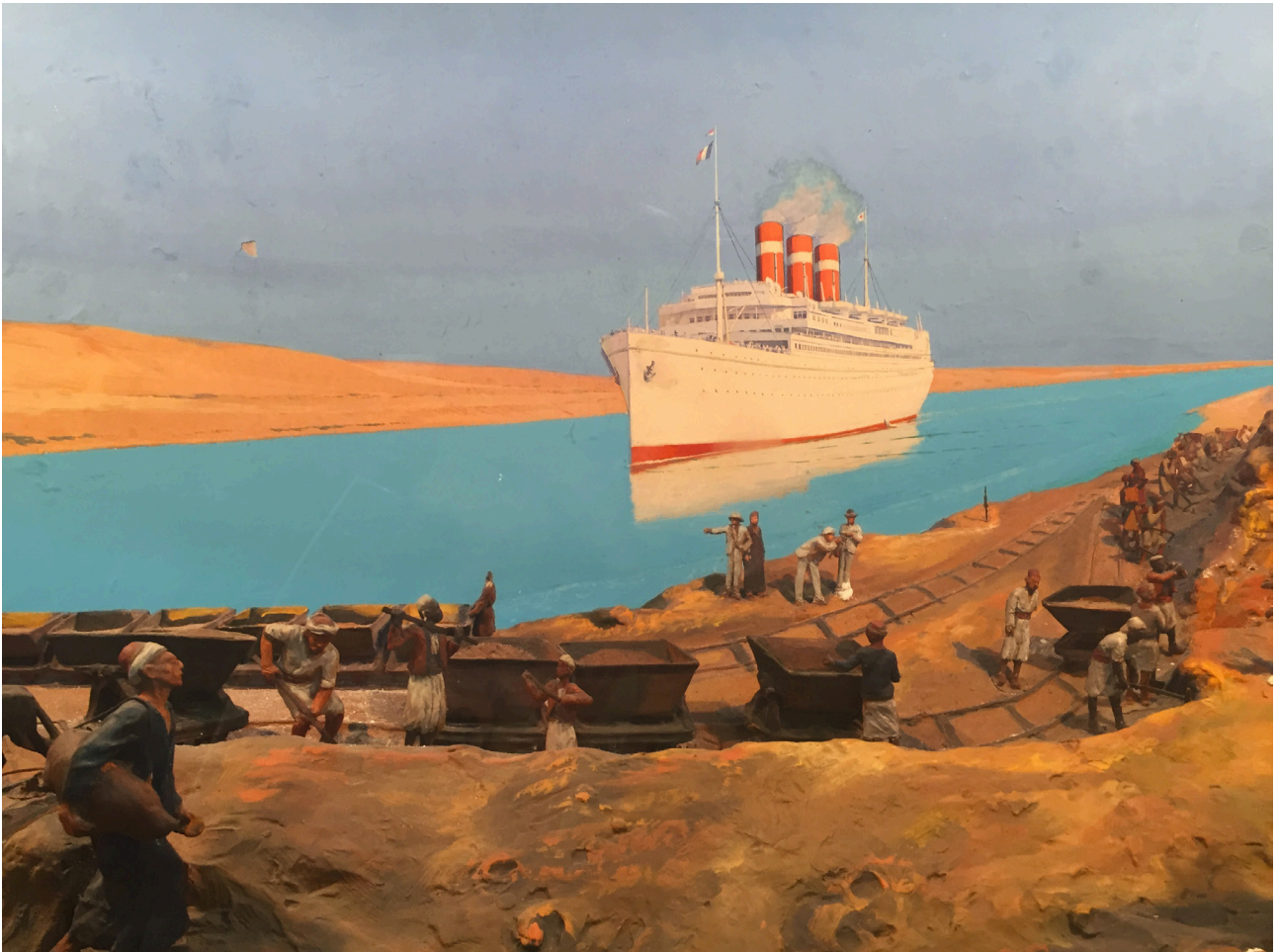
Vers les mers du Sud

Vernissage presse le 26 mars de 9h30 à 13h