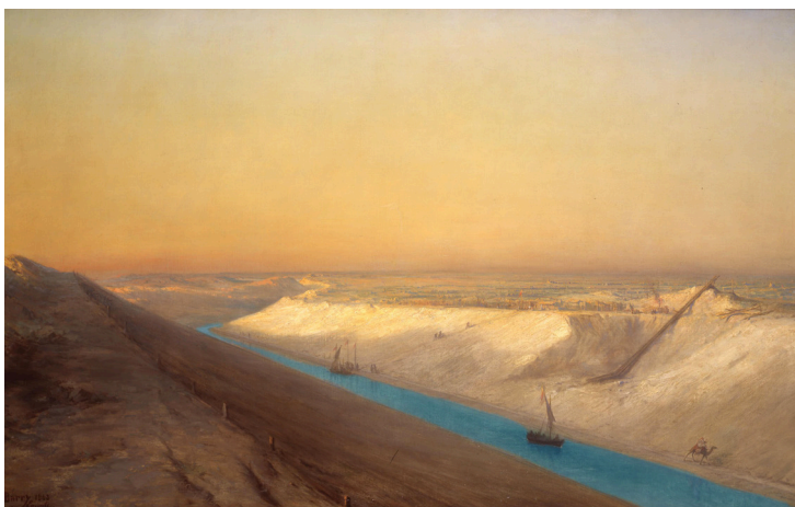
Le Chantier n°6 : l'eau de la Méditerranée arrivant dans le lac Tinsah le 18 novembre 1862, de François Pierre Bernard Barry

C'est le Pharaon Sésostris III qui, en reliant le Nil à la Mer Rouge, va le premier, 18 siècles avant notre ère, rendre la navigation possible entre la Méditerranée et les mers du Sud. Ce Canal antique, ensablé parfois, constamment remis en état, va continuer à exister pendant plus de 20 siècles. Après qu'il soit devenu inutilisable, de nouveaux projets apparaissent à Constantinople ou à Venise, sans parvenir à voir le jour.