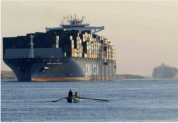
Traffic sur le nouveau Canal de Suez