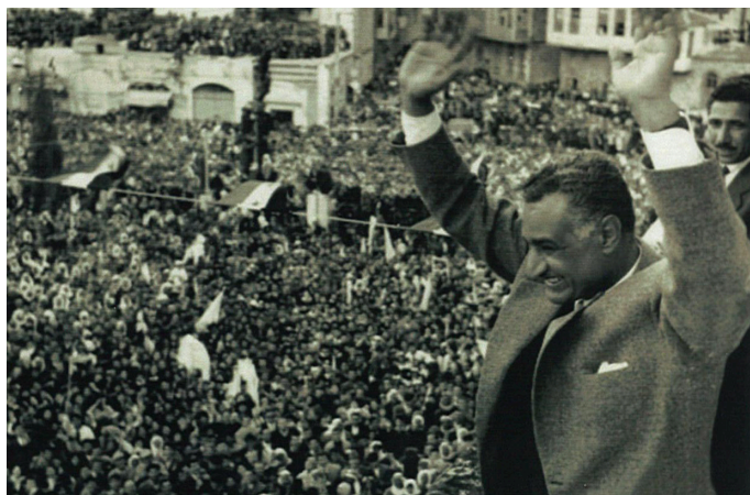
Nasser nationalise le Canal de Suez en 1956.

Discours de Gamal Abdel Nasser (Alexandrie, 26 juillet 1956)