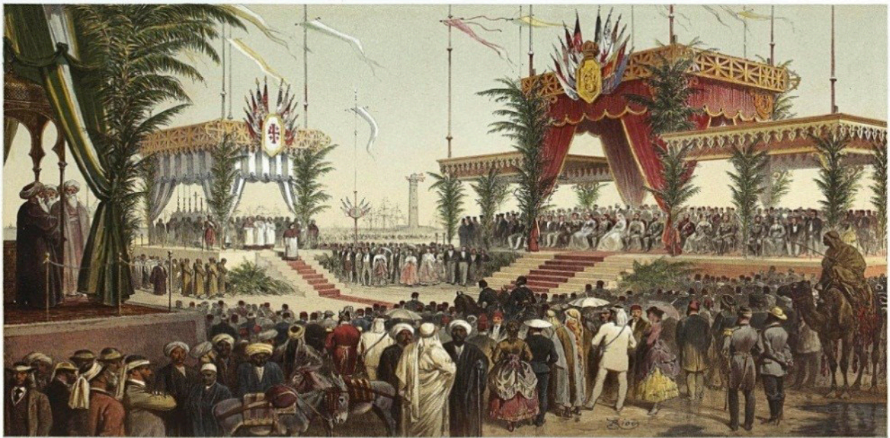
Inauguration du Canal de Suez. Tribune des Souverains